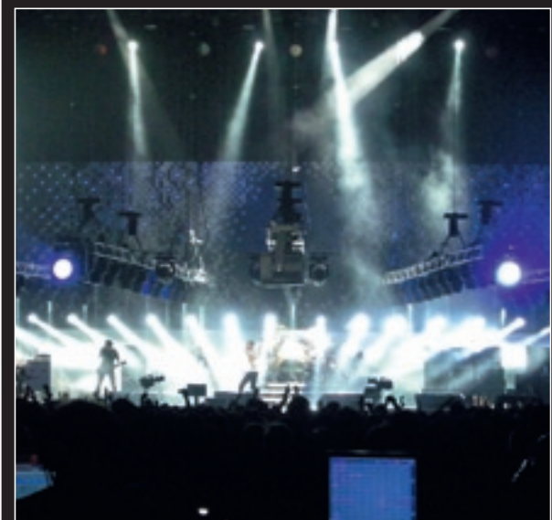
COSMOS ROCKIN'. Der Titelsong des neuen Albums zeigt den vollen Bombast. Sieben riesige Lichttraversen schweben knapp über den Köpfen der Musiker. Spektakulär!