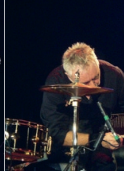
LOVE OF MY LIFE, '39. „Wollt ihr mitsingen?“ Auf der Zweitbühne am Ende des Catwalks bittet Brian May bei Freddie's Lieblings-Song „Love Of My Life“ um Stimmeinsatz. Bei „'39“ präsentiert man sich als witzige Country-Band.