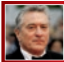
Robert DeNiro Hollywood-Legende

Inspiration. Obwohl ich ihn leider niemals getroffen habe, weiß ich, dass Freddie jemand war, der das Leben in vollsten Zügen genossen hat. Seine ständige Gratwanderung zwischen Kitsch, Bombast und Selbstmitleid war für mich mehr Inspiration als alle Hardrock-Sänger zusammen. Wer für Musik-Legenden wie Bohemian Rhapsody , Spread Your Wings oder We Are The Champions verantwortlich zeigt, dem gilt Respekt. Freddie wird für mich immer der größte Held der Musik-Szene bleiben.