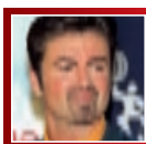
George Michael Fast-Queen-Sänger

Klasse für sich. Queen finde ich bis auf die Songs Killer Queen und Hammer To Fall vollkommen überbewertet. Bombastischer Dampfhammer-Rock, der an mir völlig vorbei geht. Doch Freddie Mercury war trotzdem eine Klasse für sich. Wie er ein ganzes Stadion durch simples „Eo“-Geschrei in der Hand hatte, war phänomenal. Dazu seine Bühnen-Bewegungen. Ich wünschte mir, mein Bruder Liam hätte sich davon etwas für uns abgeschaut.