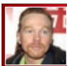
Axl Rose Guns N' Roses

Inspiration. Obwohl ich ihn leider niemals getroffen habe, weiß ich, dass Freddie jemand war, der das Leben in vollsten Zügen genossen hat. Seine ständige Gratwanderung zwischen Kitsch, Bombast und Selbstmitleid war für mich mehr Inspiration als alle Hardrock-Sänger zusammen. Wer für Musik-Legenden wie Bohemian Rhapsody , Spread Your Wings oder We Are The Champions verantwortlich zeigt, dem gilt Respekt. Freddie wird für mich immer der größte Held der Musik-Szene bleiben.